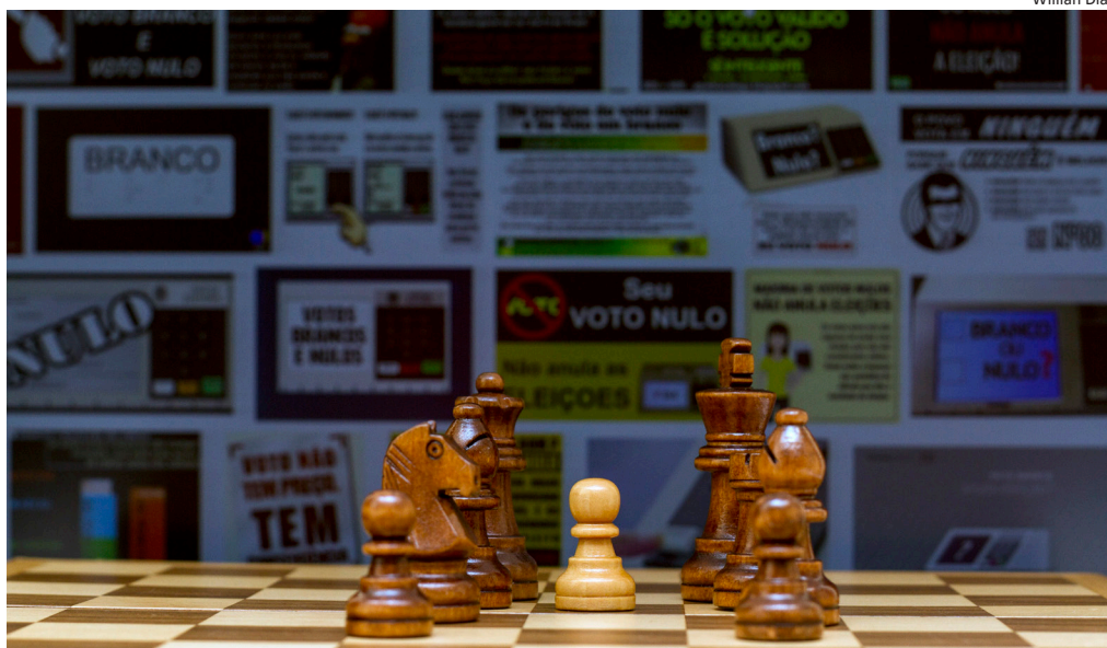
No xadrez eleitoral, nulidade das eleições não tem relação com o número total de votos nulos e brancos

Assim, uma coisa é anular o voto ou votar em branco para exercer o direito à liberdade de escolher ou não algum candidato, ou como forma de protesto; outra, é achar que isso tem o poder