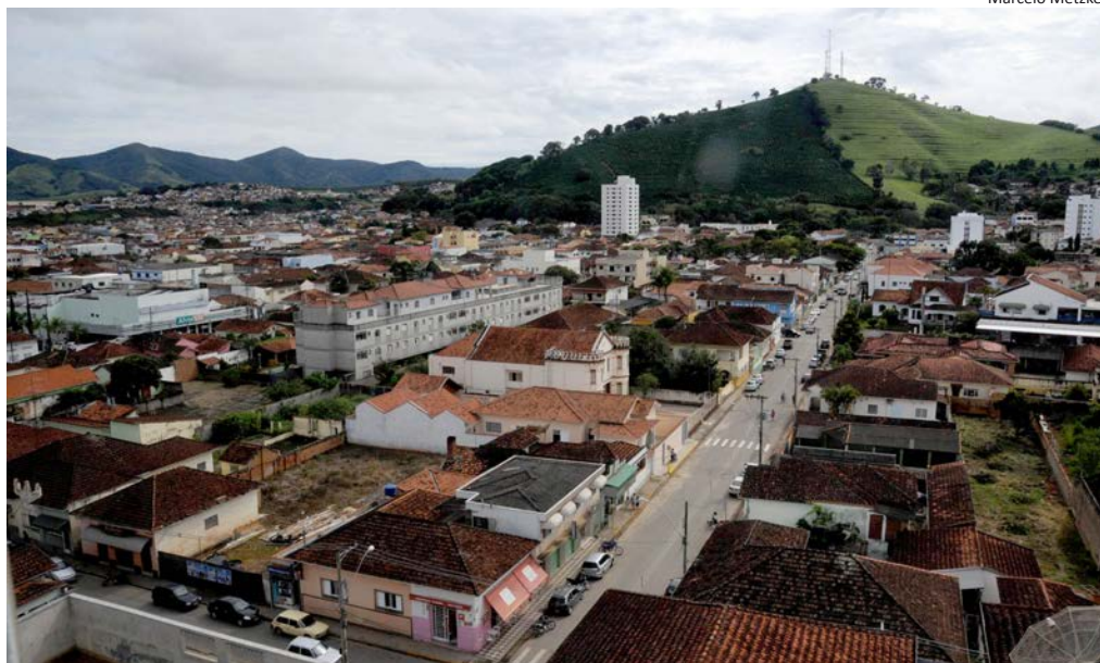
O município de Santa Rita do Sapucaí (foto) abriga o chamado Vale da Eletrônica

Programação – Logo na abertura da etapa de Santa Rita do Sapucaí, o público participará de um painel de contextualização sobre o ecossistema desse tipo de empresa. Na sequência, os participantes vão se dividir em grupos de trabalho, os quais devem prosseguir até o fim da tarde. Serão três grupos e cada um vai explorar um dos seguintes temas: “ Startups , empreendedorismo e inovação;